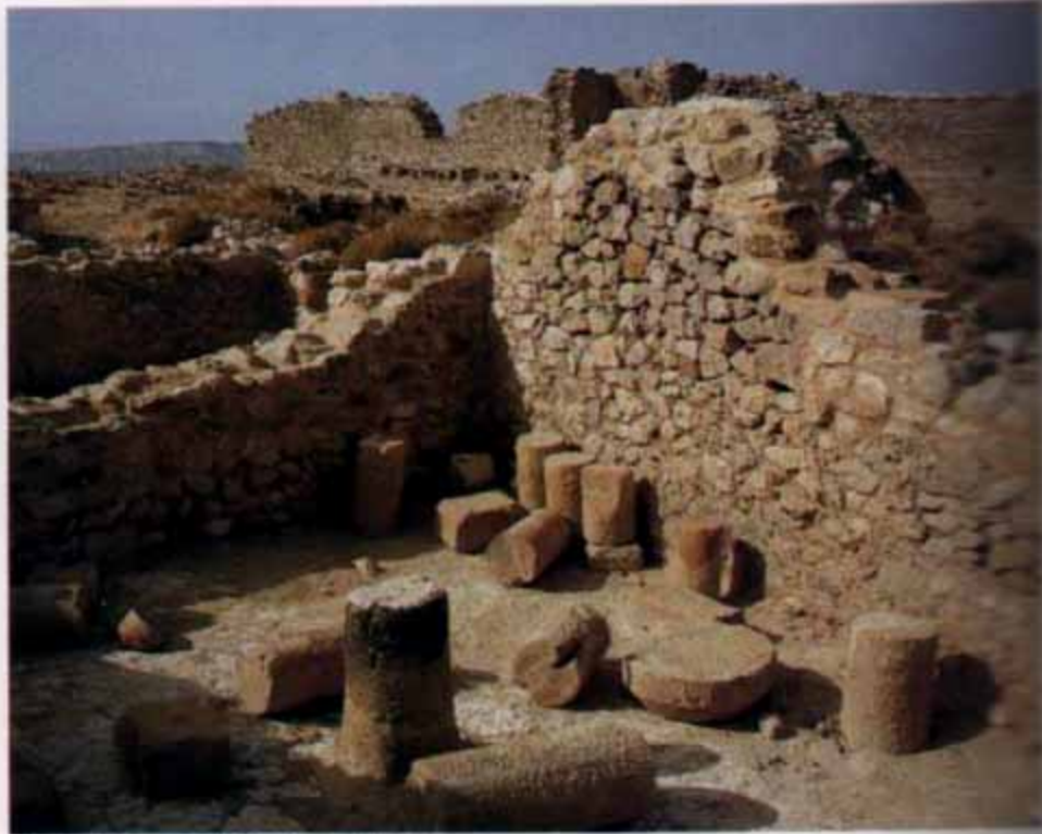
Excavaciones en el desolado de Rada.

Durante las discordias civiles de tiempo de Juan II, la villa y el castillo fueron ocupados por los beaumonteses. En 1455, mosén Martín de Peralta, caudillo agramontés, los sitió con numerosas huestes, ocupándolos al poco tiempo en nombre