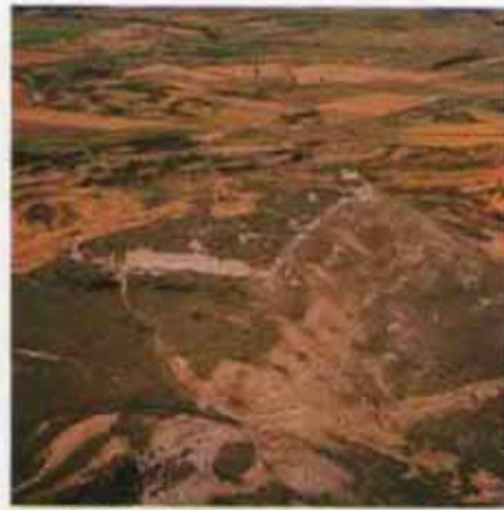
Desolado de Rada.

HISTORIA: Todavía subsisten, sobre un cerro situado entre Caparroso, Traibuenas, Santacara y Mélida, las ruinas del castillo y murallas de Rada. Perteneció originalmente al noble linaje del mismo