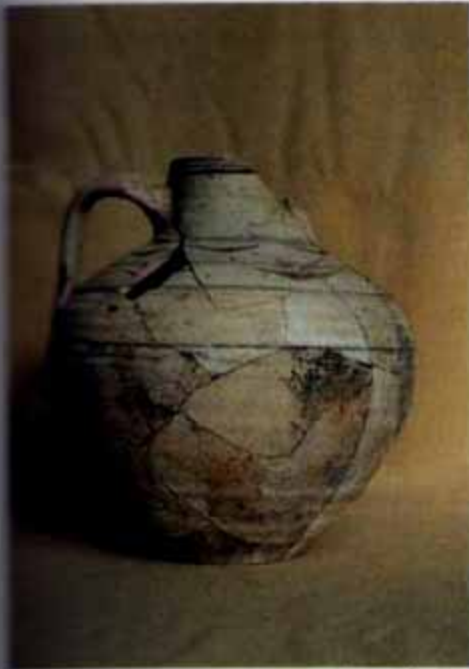
Cerámica del des poblado de Rada (MN).

carpintería, reforzada con ramajes y tejas, de las que se han encontrado abundantes restos, pero no tantos como para considerarlo el único sistema de cubierta utilizado.