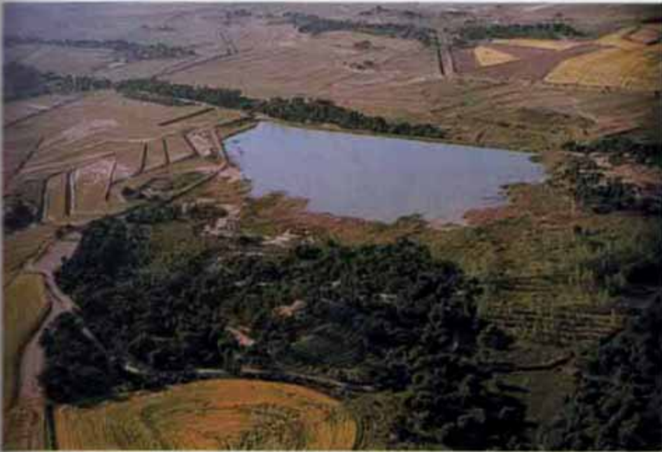
Balsa de Rada.

su volumen. Actualmente ocupa una superficie aproximada de 2.15 Ha y embalsa algo más de 21.000 m 3 procedentes de la escorrentía superficial de las tierras adyacentes. Cuando desciende el nivel, y se considera oportuno, se llena con aguas derivadas de la Acequia de Navarra. JCN.