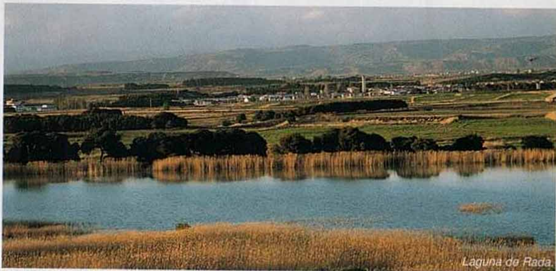
Laguna de Rada.

En 1987 la Laguna de Rada fue transferida al Gobierno de Navarra, que declaró la zona como Área Natural Recreativa, acondicionándola con una casa para el guarda, caminos, fuente, servicios, asadores, merenderos y miradores. Recientemente se han instalado también unos paneles informativos y un rústico observatorio de aves entre el carrizo de la orilla.