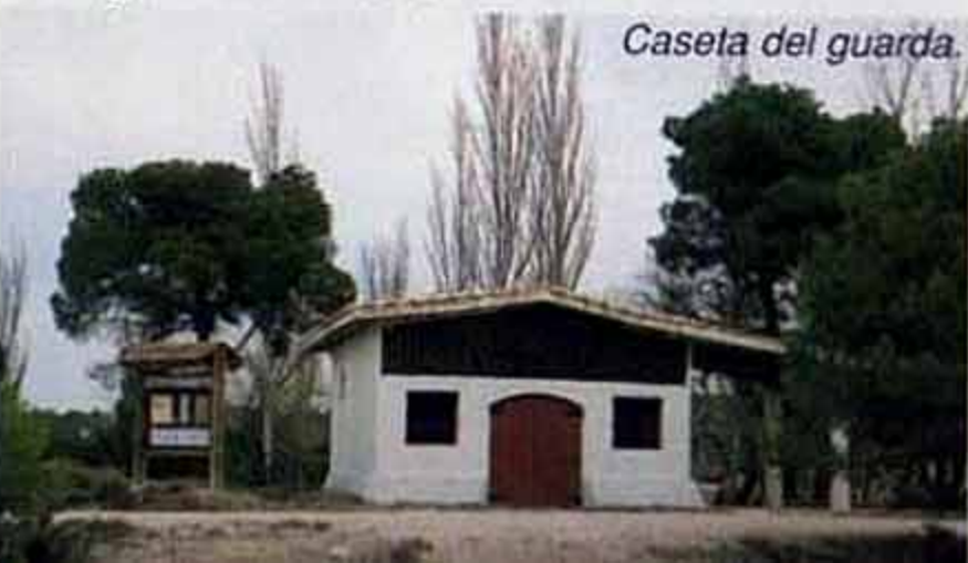
Caseta del guarda.