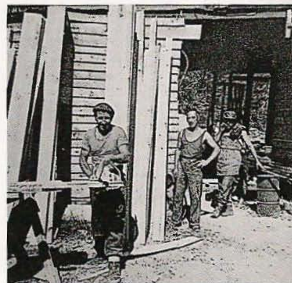
PRESENTACIÓN E IMÁGENES QUE ILUSTRAN EL LIBRO.

hacia lo desconocido y formábamos parte de ese gueto de emigrantes que se movía de un lugar a otro". Los sacrificios y los retos que tenían por delante no fueron obstáculo para vivirlo, desde su óptica infantil, como una aventura y una ocasión inmejorable de ampliar sus horizontes en este su primer viaje fuera de Murillo el Cuende, Murillete, su pueblo natal del que desciende toda su familia. Montes que daban pan , ilustrado con fotografías tratadas por el artista Natxo Zenborain, nos da una radiografía de la sociedad puritana e hipócrita del momento y supone también un reconocimiento al sacrificio de todos los hombres y mujeres que un día salieron con lo puesto, obligados a explorar otros mundos y soñando siempre con volver a su aldea. Una obligada reflexión en la que mirar-